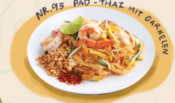
NR. 95 PAD - THAI MIT GARNELN