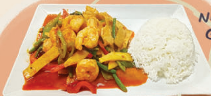
NR.265 GAENG PAH MIT GARNELEN

260. Gaeng Pah แกงป่า ๓๓๓๗๓๓๓๓๓๓๓ Rote Curry, Bambus, Bohnen, Paprika, Zucchini, Thai-Basilikum mit... (mit Tofu oder Fleisch nach Auswahl) Red curry with bamboo, beans, paprika, zucchini Thai basil with... (with tofu or meat of your choice)