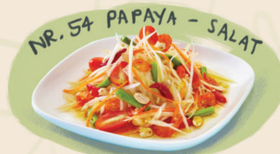
NR. 54 PAPAYA - SALAT