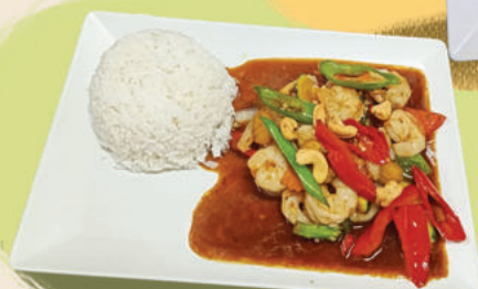
NR.308e Pad Pak Tur Ngong